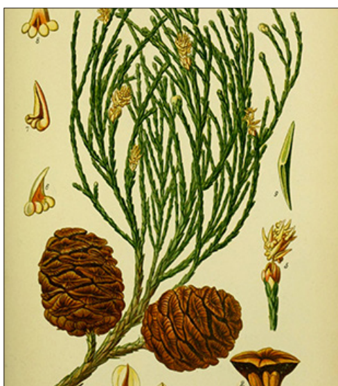
Вид гигантска секвоя, шишарки