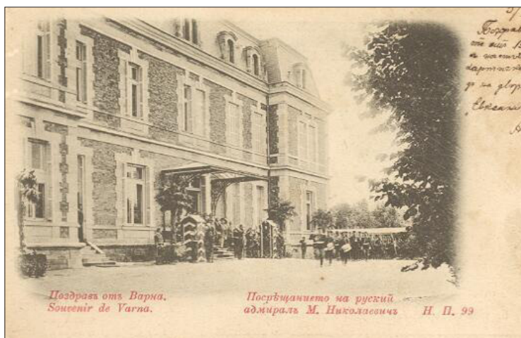
Посрещането на руския адмирал М. Николаевич

В двореца често гостуват представители от различните императорски дворове на Европа. В интервю пред чуждестранни журналисти царица Йоанна – съпруга на цар Борис III, в коментар за спомените си от България заявява: „Рилският манастир и Евксиноград край Варна. Аз обичам планината, но Евксиноград беше моята мечта“ (П. Стоянов. Цит. съч. 45 – 47).