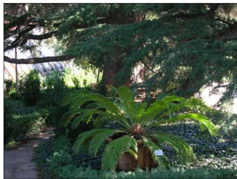
Оранжерията и растителни видове