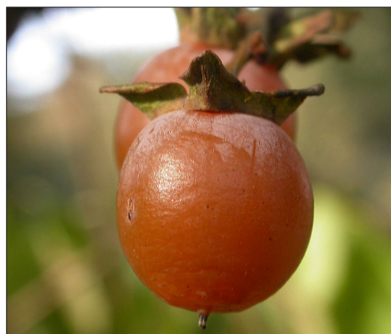
Кавказка райска ябълка

След тях – пищни рози, рододендрони и азалии се спускат към морския бряг. Проектът на Мартине за обширен крайбрежен парк включва рядка колекция от дървета – от червен дъб до атлантически кедър, които се срещат единствено тук на Балканския полуостров. От внесените видове в парка успешно се приспособяват: Sterculia platanifolia , Paulownia tomentosa , Criptomeria japonica , Liriodendrin tulipifera , Quercus ilex , Diospiris lotus , Lagerstroemia indica , Hibiscus siriacus , Zyzyphus vulgaris , Cercis siliguastrum , Brous-sonetia papurifera , Ficus carica , Maclura aurantiaca , Cedrus atlantica , Cedrus deodara , Cedrus libani , Sequoia gigantea , Cupressus pyramidalis и много други. Между 1914–1930 г. е засадена секвоята, внесена от Северна Америка.