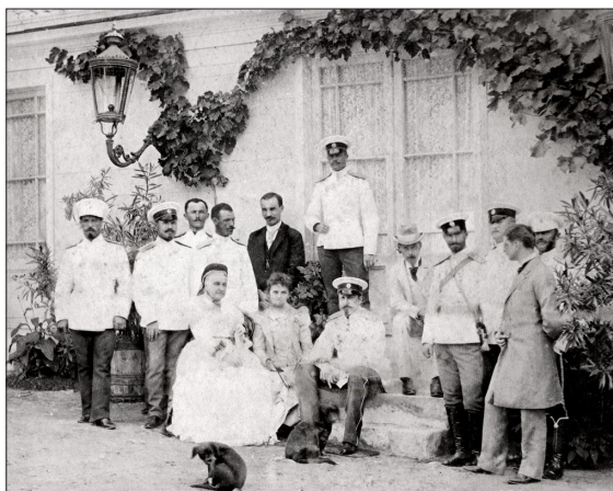
Княз Фердинанд и княгиня Клементина със свитата си в Евксиноград, 1893 г.