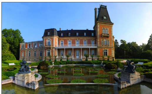
Граф Робер дьо Бурбулон в двореца в София