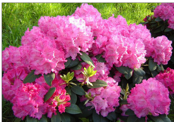
Рододендрони и азалии