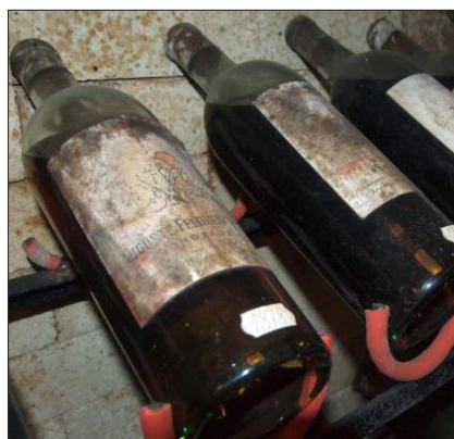
Стари вина от 1878, Евксиноград