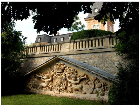
Вграден детайл от Сен Клу

При изграждането на парка са използвани идеите на бележития майстор на парковото изкуство Андре Льо Нотр (1613 – 1700) – най-големия френски градински и ландшафтен дизайнер от XVII в., който претворява на практика идеите на краля-слънце Луи XIV (1638 – 1715) за величие и хармония. Бароковият стил на градинския дизайн, който той довежда до върхови постижения, придобива широко влияние в Европа и по света. Вдъхновението за създаването на тези градини идва от италианските им ренесансови прототипи от XIV и XV в., както и от идеите на френския философ Рене Декарт (1576 – 1650).