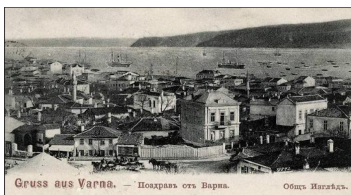
Gruss aus Varna. — Поздравъ отъ Варна. Общъ Изгледъ.

Резиденцията Евксиноград е построена в края на XIX в. за летен дворец на монарсите от Третото българско царство. На девет километра от Варна, на живописния бряг и във великолепен парк, резиденцията на българските владетели след Освобождението прави Варна лятната столица на България.