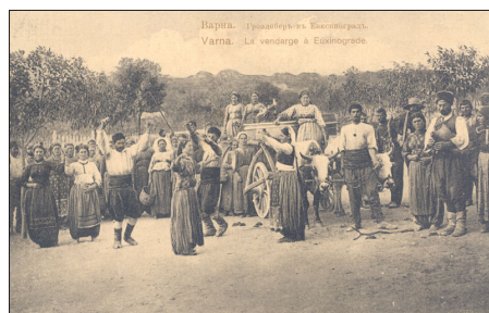
Лозя и гроздобер в Евксиноград