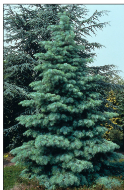
Кипариси и ела