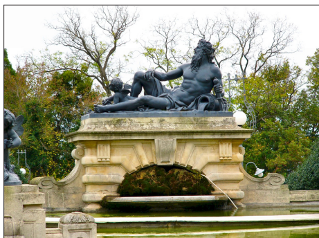
Скулптурна фигура на Нептун

се виждаше френският кралски герб, пренесен камък по камък с Ориент експреса [...] (Ст. Константи. Цит. съч., с. 217).