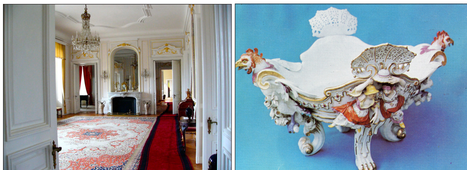
Евксиноград, интериор – полилеят на Бурбоните и оригинална порцеланова купа

златисти копринени тапети, с много вкус са подредени приемните салони, столовата, кабинетът.