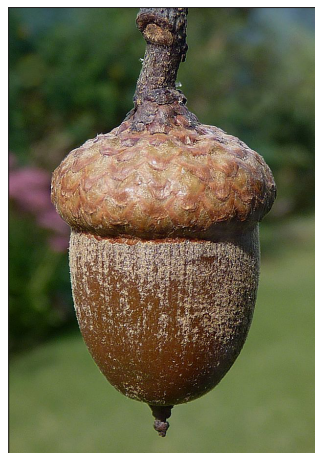
Американски червен дъб с жълъд