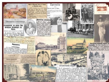
Варненските морски бани