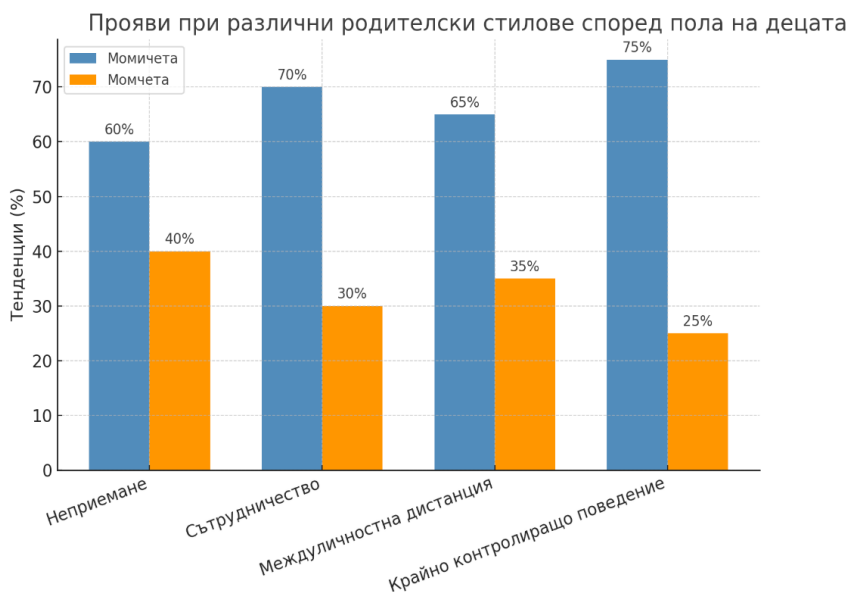
Фигура 2. Прояви при различни родителски стилове според пола на децата

Крайно контролиращо поведение – изискването за безусловно подчинение (въпроси 1 – 3) води до строго формирани привички и навици (по-често при момичетата) или до стремеж за доминиране и пренебрегване на чуждото мнение (по-често при момчетата).